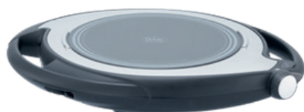
Mobil főzőlap 52-55. oldal