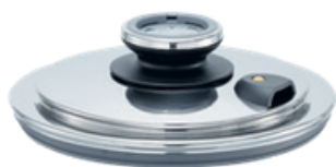
Gőzfőző és pároló fedél 48-51. oldal