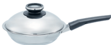
Serpenyők 32-43. oldal