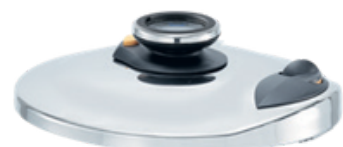
Gyors főző fedél 44-47. oldal