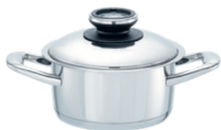
Edények 26-31. oldal