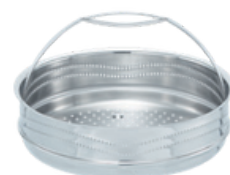
Tartozékok 56-65. oldal